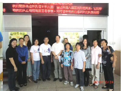
大良聖堂服務留影