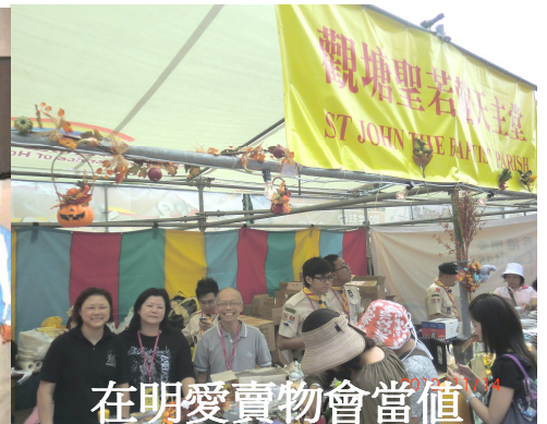
在明愛賣物會當值