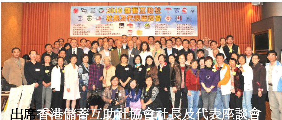
出席香港儲蓄互助社協會社長及代表座談會